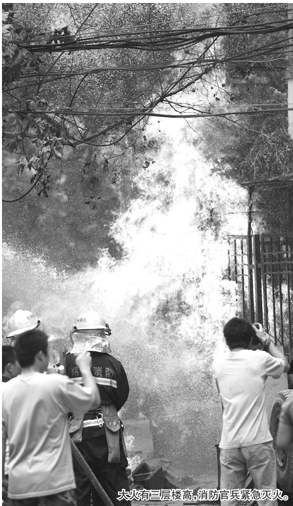
大火有三层楼高,消防官兵紧急灭火。