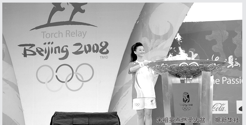
宋祖英点燃圣火盆。

昨日参与传递的火炬手中有许多体育明星。包括奥运冠军刘璇,身残志坚的桑兰,台球世锦赛冠军潘晓婷。在29名外籍火炬手中,也不乏外籍运动员,其中包括前古巴女排主力队员、三届奥运会冠军、世锦赛两夺金牌的路易斯等。 晚报记者 秦明伟