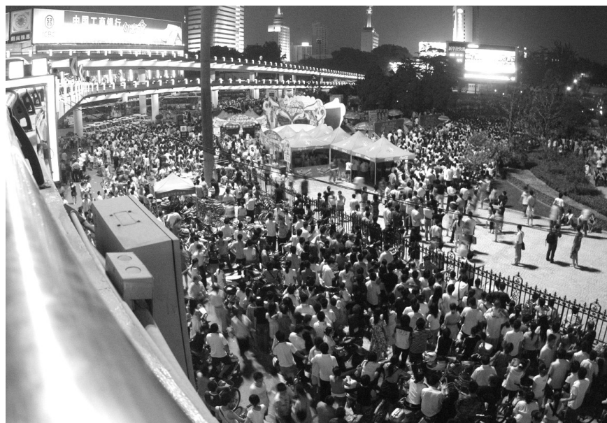
紫荆山立交桥下人山人海。