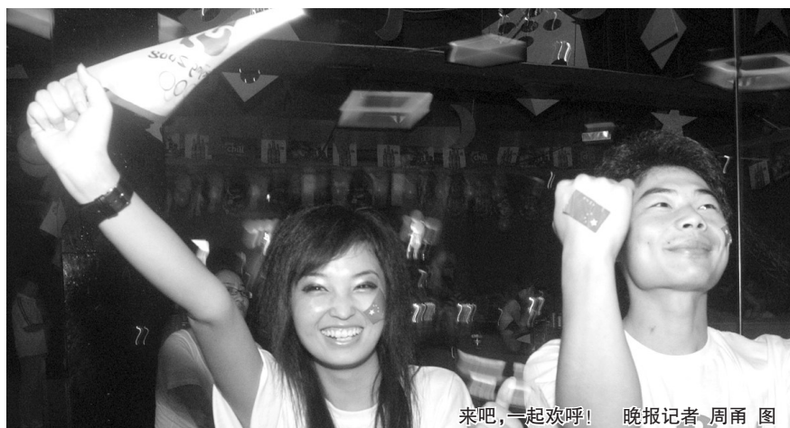
来吧,一起欢呼!