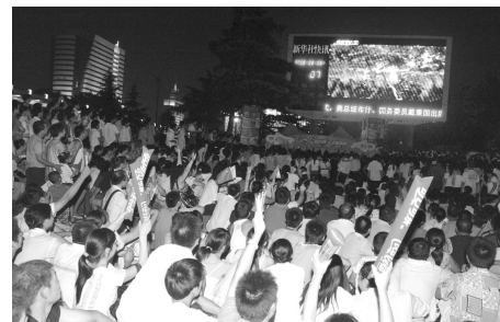
一起看开幕式更过瘾。