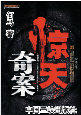
惊天奇案 中国三峡出版社

“其实,让我高兴的还不是这件事。现在我们的问题有两个,那邮件里的梁,是不是指梁兴盛呢?而且,那从林政处转让给梁的百分之五到底是什么呢?如果我们查明了,说不定就知道凶手策划这一系列行动的