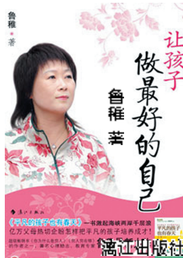
让孩子做最好的自己 漓江出版社