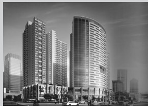
名门国际屹立于金水区农业路与经一路交会处,占据农业路龙首地段。在经三路财富商圈簇拥下创造5分钟生活圈,精英阶层衣食住行用享之不尽。