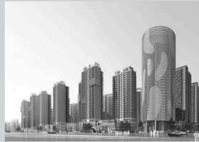
威尼斯水城位于中原区五龙口南路以南,桐柏路以西。三期以9层、16层、18层、32层住宅为主,区内设有小区会所等社区配套服务。