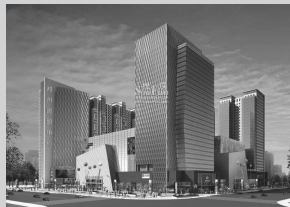
郑州国贸中心位于总部大道农业路和形象大道花园路交会处,48万平方米超大规模、高辐射性区域优势,融合酒店式公寓及甲级写字楼为一体。