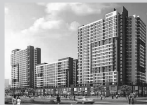
明天花园位于丰庆路与博颂路交界处,总建筑面积为8万平方米左右,主要建筑为20层住宅,沿街2层为商业用房,项目整体定位为:北区首席青春派时尚新锐社区。