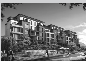
鑫苑逸品香山项目位于郑州市花园路与英才路交叉口西500米,南靠贾鲁河,西临大学城,北边临黄河迎宾馆,东临花园路。为带电梯的墅院洋房。

本期看房主题：郑州经典品牌楼盘（见下图） 本期各楼盘对看房者均有特殊优惠 机会难得 请速报名 发车时间：周六（8月16日）早8：30集合 发车地点：省人民会堂门口 报名电话：0371-67655013