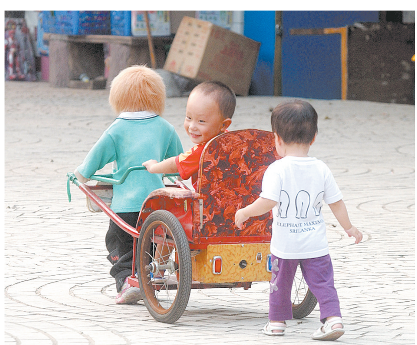
上个周末很凉快,孩子在绿荫广场上玩耍很尽兴。

“第二天才想起鸟,两个朋友也不记得把鸟放在哪儿了。这两只鸟跟着我一年多了,非常有感情。”杨先生说,两天来,他一直在找鸟。 线索提供 赵小亮