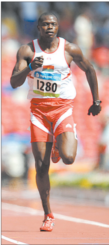
15日,布基纳法索选手伊德里萨·萨努在男子100米预赛中。