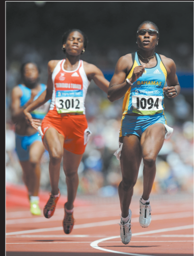
16日,巴哈马选手黛比·弗格森·麦肯兹(右)在女子100米预赛中。