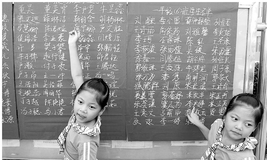
8月23日上午,郑东新区聚源路小学一年级新生的招生情况张榜公布,一对双胞胎姐妹给妈妈指着新生名单上自己的名字。

今天,郑州市区的中小學生要开始新学期的学习和生活了。昨日是学生们到校报到的时间,一年级新生也在陆续放榜,很多家长到学校查看孩子分到了哪个班里。昨日,记者从各区教体局了解到,目前小学招生工作虽然已经告一段落,但是仍然有一些学生还没有解决上学问题。由于今年各区小学新生的生源压力较大,预计多数一年级新生不能在今天按时开学。 晚报记者 张勤 实习生 曹晓雪/文