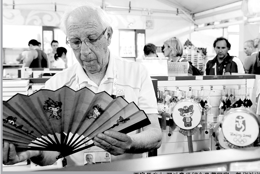
西班牙老人,买价奥运纪念品带回家