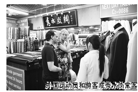
外国运动员和游客成秀水街常客