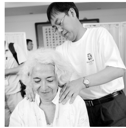
外国记者:体验中医