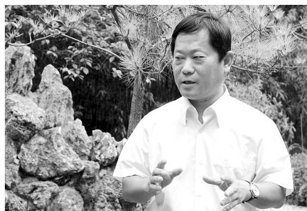
访谈主角 上街区委书记周春辉