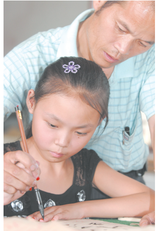
河南书法也“从娃娃抓起”(上两图)

中原作为华夏文明的诞生之地,其文化底蕴深厚。中原书法在这种文化环境中生长,在积极汲取中原文化营养的同时,又积极地再现着中原文化,从而使书法在这块土地上养成一种特色鲜明的风气——以儒道为思想基础,以三代碑版为书法源泉,以中原地域的民族性格、审美趣味为审美追求,勾画出一部书家辈出、经典纷呈、风格多样、追求执著的壮丽画卷:中原书风。