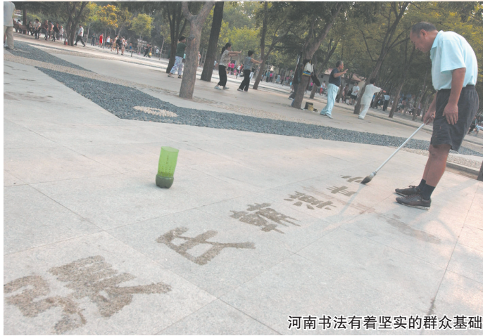
河南书法有着坚实的群众基础