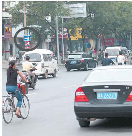
这个禁止左转的标志牌不显眼。

能不能通过晚报给交警提个建议?那个提示牌只针对超市停车场出来的车,能不能安装在停车场的出口处,这样就不会有车违章了。