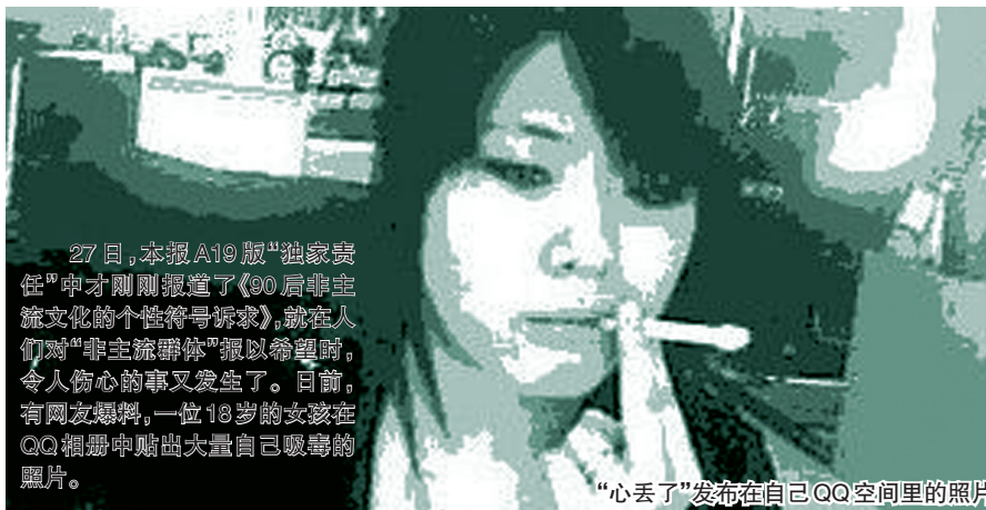
27日,本报A19版“独家责任”中才刚刚报道了《90后非主流文化的个性符号诉求》,就在人们对“非主流群体”报以希望时,令人伤心的事又发生了。日前,有网友爆料,一位18岁的女孩在QQ空间里贴出大量自己吸毒的照片。

记者试图联系到“心丢了”本人,却迟迟没有收到回复。昨日上午,她出现在空间里,看到了网友们的留言(大部分是一些劝导性的话),之后就消失了,而且她的吸毒照片已被删除,其博客空间也被站方封闭。根据其空间信息显示,她现在住在北京市朝阳区。当地警方昨日告诉记者:“有关她的情况,网监部门会介入调查。”