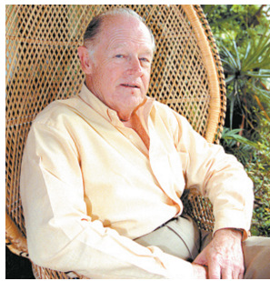
霍华德·亨特的一生充满争议