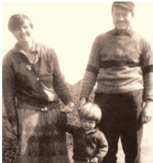
海明威与第一任妻子哈德利和儿子约翰在一起