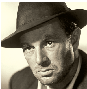
斯特灵·海登曾参演黑帮电影《教父》