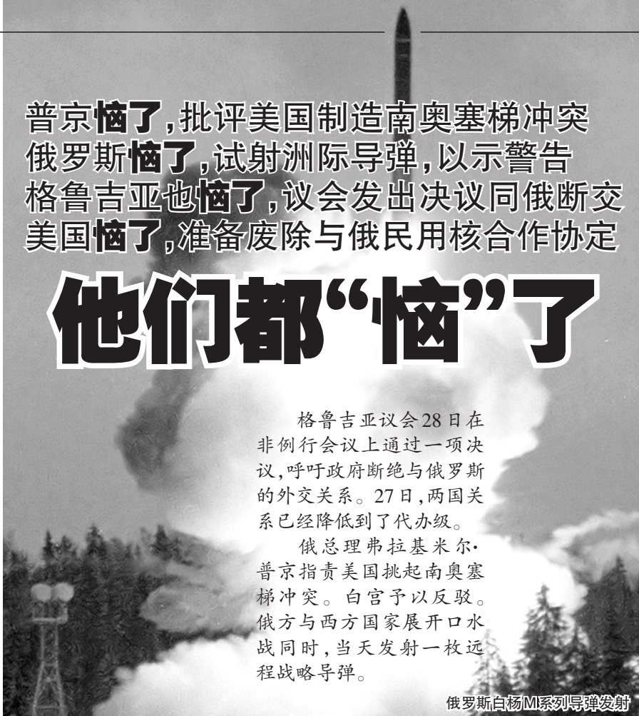
俄罗斯白杨M系列导弹发射

格鲁吉亚议会28日在非例行会议上通过一项决议,呼吁政府断绝与俄罗斯的外交关系。27日,两国关系已经降低到了代办级。