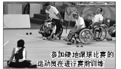
参加硬地滚球比赛的运动员在进行赛前训练