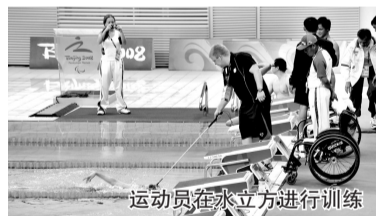
运动员在水立方进行训练