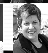
亚利桑那州州长纳波利塔诺