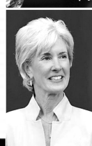
堪萨斯州州长西贝利厄斯