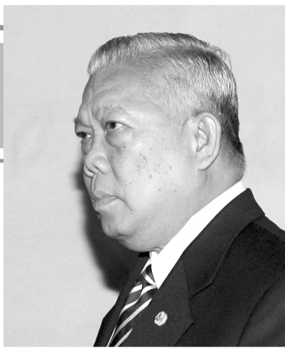
沙马:拜托!我拿的是演出费好不好?