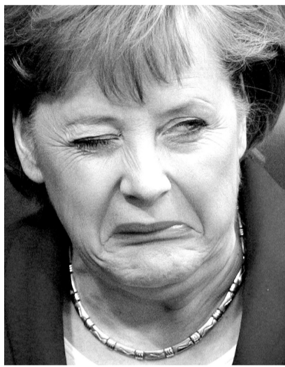
默克尔:挑战我?放马来试试!