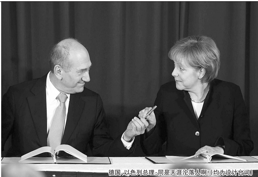
德国、以色列总理:同是天涯沦落人啊!(均为设计台词)

与明特费林的立场一致,施泰因迈尔明确表示支持经济改革计划“2010日程”,以降低失业率,在2011年之前实现财政收支平衡。