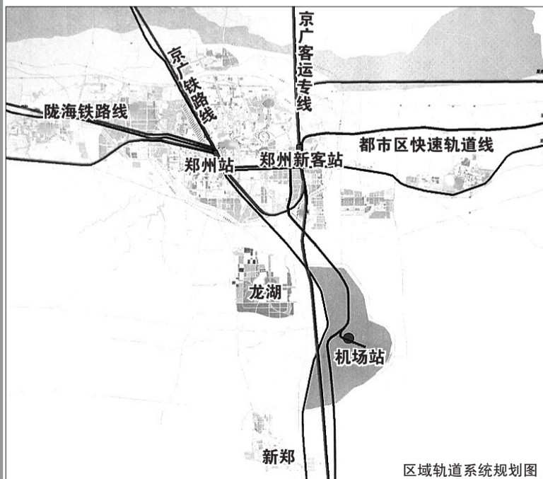
区域轨道系统规划图