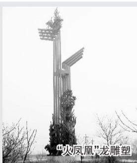
蚌埠 建成中国南北分界线标志雕塑