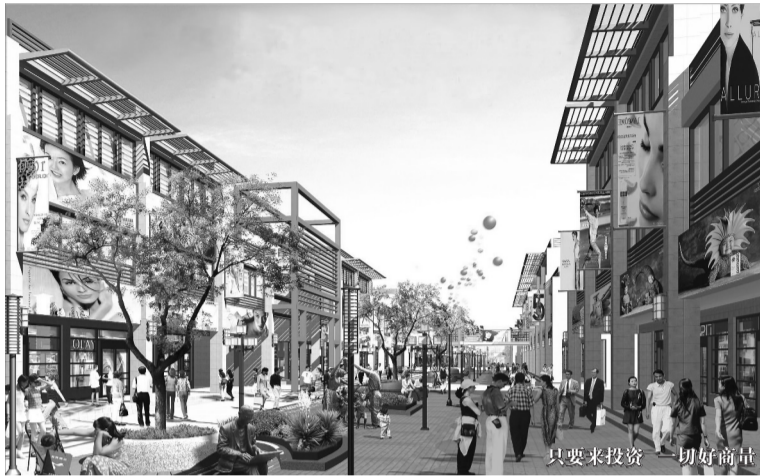
只要来投资 一切好商量

为扩大郑州市城区建设,在郑州市城区与新密市及新郑市交界的金三角地段,两年前在省政府批准下,成立了“郑州曲梁服装工业园”(郑州曲梁服装城)。郑州曲梁服装工业园是河南省政府重点建设项目,也是郑州市政府跨越式发展的重点园区。在郑州曲梁服装工业园的成立之初,省有关部门负责人专门为此批示打响郑州服装品牌,刻不容缓!如今两年时间过去了,这里现在发展的情况如何呢,笔者近日专程前往进行打探了一番。