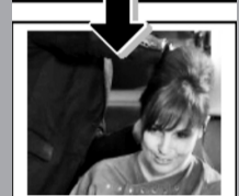
作出“小山坡”,用夹子固定