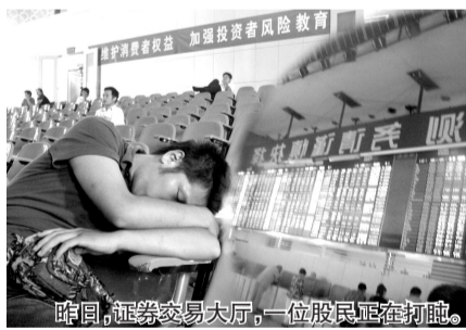
昨日，证券交易大厅，一位股民正在打盹。

广发证券的资深分析师则认为，数年来的首次降息说明政策导向已由前期的抑通胀向保增长转化，经过短期的情绪宣泄后，股指在本周仍然具备企稳回升的动力。