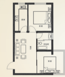
J1 高层户型：参考面积：64.08m 2