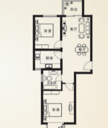
J3 高层户型：二居室 参考面积：86.50m 2

本宣传品所有文字和图片仅供参考，不作为合同要约，买卖双方权利义务以合同为准，所有细节以政府批文与法规文件为准