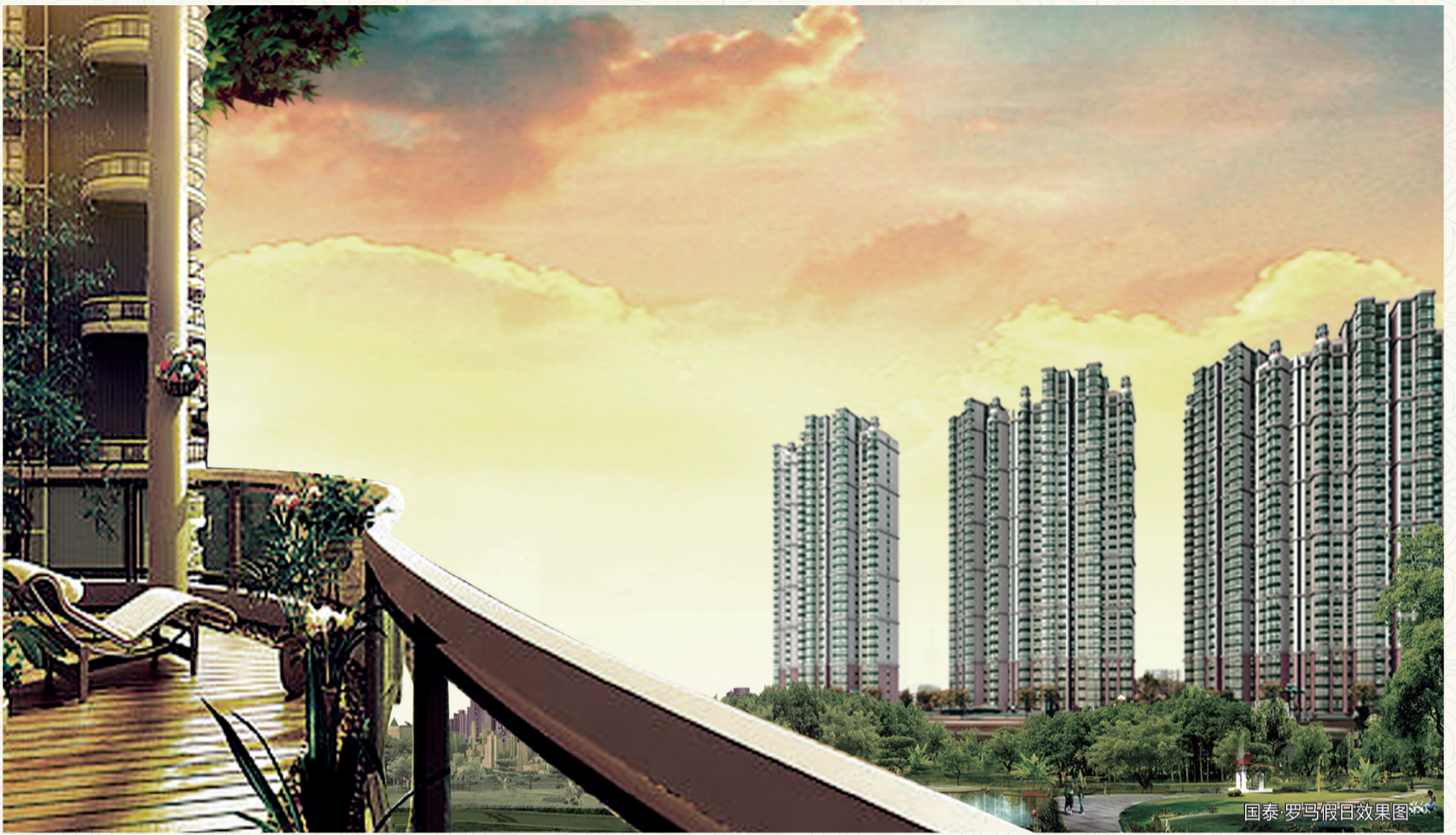
国泰·罗马假日效果图

[2008]国房证豫字第223号 预售广告 本广告存在不实行为属无效 需持此证向房产管理部门开发商保留解释权