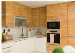
宽敞明亮厨房里，烹饪丰盛生活，让你产生甘心为爱人当一辈子“厨子”的幸福欲望。