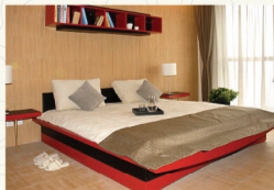
主卧带超大阳台，通透视野，采光充足，清雅的居住空间，让阳光更亲近家人，享受更多阳光宠爱。