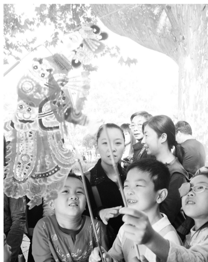
国家非物质文化遗产信阳罗山皮影舞动欢乐