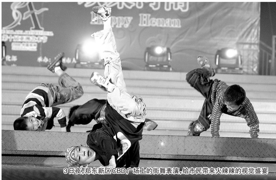
3日夜,郑东新区CBD广场上的街舞表演,给市民带来火辣辣的视觉盛宴

操……”一位演员潇洒自如地转了数圈托马斯全旋后,惹得台下观众连声尖叫。“哇!铁头功?”另一位头部倒立的演员,在旋转数圈后脚步才着地,更是把整个现场气氛推向了高潮。