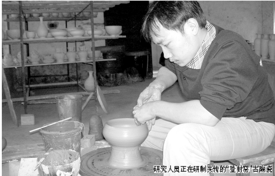
研究人员正在研制失传的“登封窑”古陶瓷