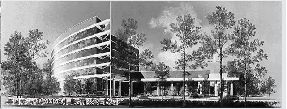
美国爱玛科(AMAC)国际有限公司总部