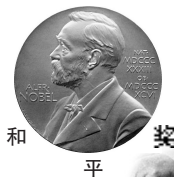
和 平 奖

阿赫蒂萨里领导的“处理危机办公室”2007年召集伊拉克逊尼派和什叶派代表秘密会晤。与会代表在借鉴北爱尔兰和南非和平进程的基础上,制订了伊拉克和平路线图。