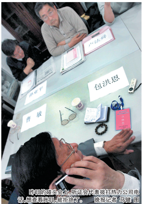
昨日的碰头会上,听证会代表拨打热力公司电话,想查看账目,被拒绝了。

左图是参加听证会的5名消费者代表,他们遇到一个问题 热力公司:财务报表是机密,不能想看就看 一位高级会计师代表说:“不让查账,我肯定反对涨价” A04 A05