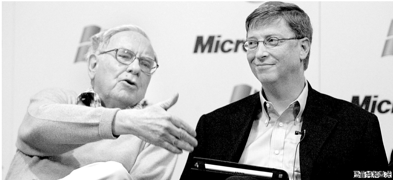
姓名:沃伦·巴菲特 身份:美国“股神” 影响力:★★★

在眼下这场金融困境中,巴菲特的所作所为似乎可以和1907年美国金融危机中约翰·皮尔庞特·摩根(19世纪末20世纪上半叶美国最重要的银行家)采取的一系列行动相比较。理查德·塞拉是纽约大学商学院的一名经济学家和金融史学家,他说:“巴菲特现在之所为与摩根在1907年之所为极为相似,你也许可以称之为是一种获利性的爱国精神。”