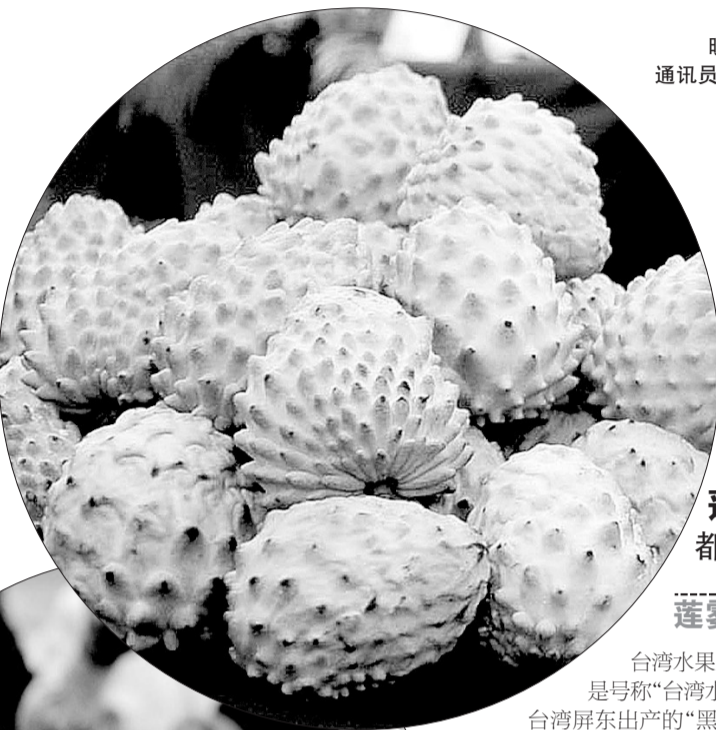
莲雾、释迦 都有药用价值