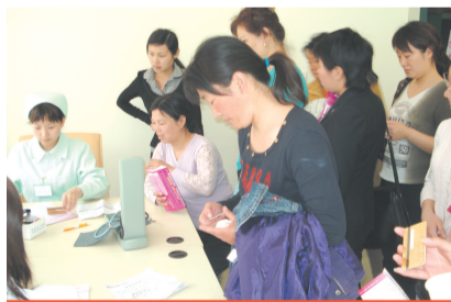
河南女性健康节暨不孕不育大型普查活动现场

由省妇联权益部、郑州新世纪女子医院联合主办的“2008中国·河南女性健康节暨不孕不育大型普查”活动结果显示:40%就诊女性患有不同程度的生殖道感染等妇科疾病,已婚妇女患病率更是高达70%,育龄女性不孕不育患病率在30%以上,输卵管病变是女性不孕的主要因素。