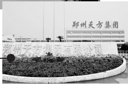
落户马寨镇的企业——天方食品厂