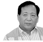
河南省作协副主席 郑彦英

的作品有新意,得到观众认可,这样的都是好作品。争议是必要的,这样才能促进文化的繁荣。文化的园地里,花草品种越多越好。电影电视剧是艺术创造,本身就会有虚构,如果认为有恶搞就拍砖打死是很错误的行为。