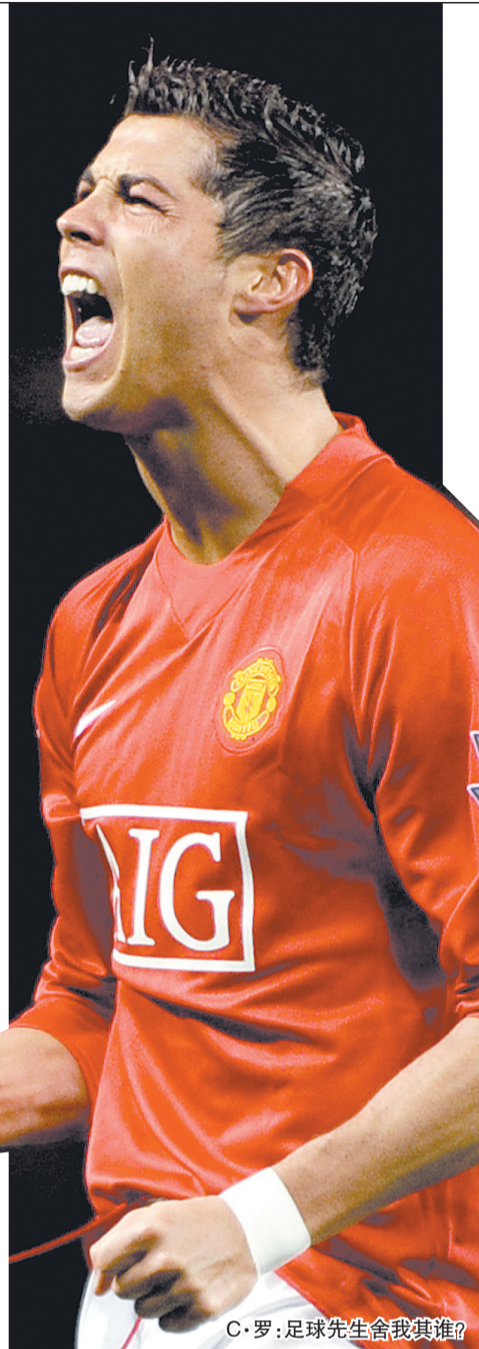
C·罗：足球先生舍我其谁？

此外，国际足联还公布了世界足球小姐的候选名单，去年的这一荣誉获得者玛塔入选。另外，去年玛塔最大的竞争者德国名将普林茨也再次加入角逐。李岩