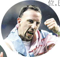
卡卡和里贝利也是足球先生热门候选人