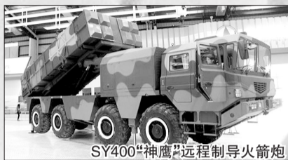
SY400“神鹰”远程制导火箭炮