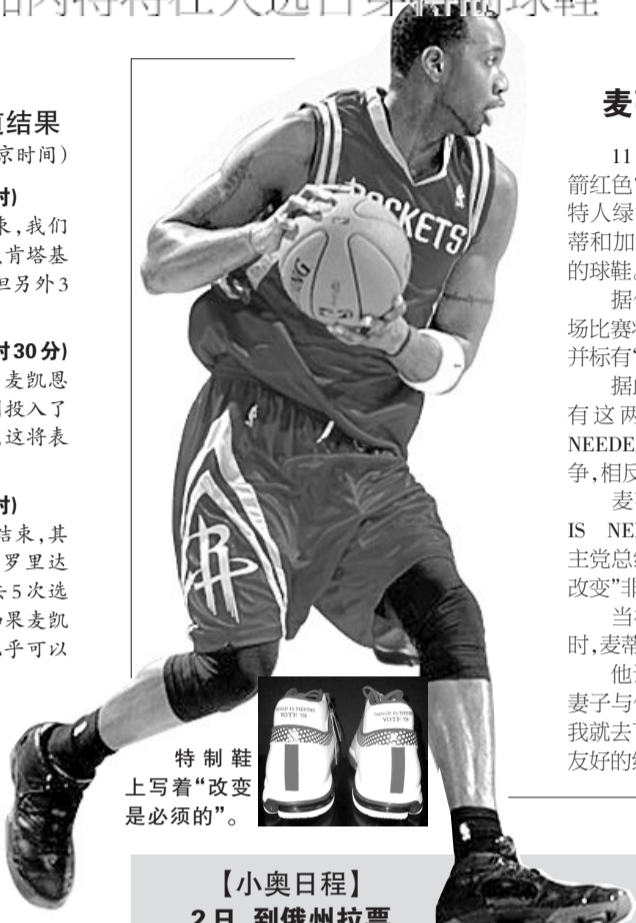
特制鞋上写着“改变是必须的”。

如果奥巴马在12时之前赢得宾夕法尼亚州、艾奥瓦州、新墨西哥州、科罗拉多州,那么加上加利福尼亚州、华盛顿州、夏威夷、俄勒冈州的77张选举人票,奥巴马将被宣布在总统选举中获胜(他获得的选举人票将达273张,超过赢得总统选举所需要的270张选举人票)。 关新