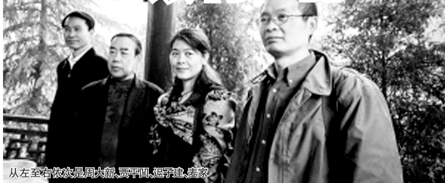
从左至右依次是周大新、贾平凹、迟子建、麦家

11月2日晚8时,在《让我们荡起双桨》的大合唱中,第七届茅盾文学奖颁奖典礼在茅盾的故乡乌镇举行。贾平凹、迟子建、麦家、周大新高兴高采烈地出席,分别领走5万元奖金。谈到这笔钱的来源,本届茅盾文学奖评委会主任、中国作协副主席陈建功说:“茅盾先生捐出的25万元存在银行里,我们没有理财,也没有去买股票。每一届会把利息取出来,有时候利息是不够的,但不能动本金,只能靠赞助的方式。”