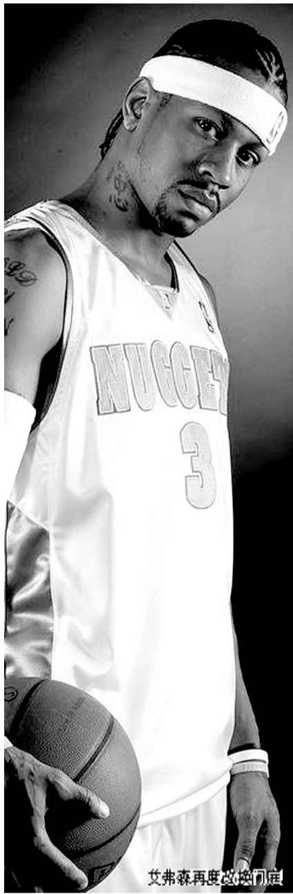
艾弗森再度改换门庭