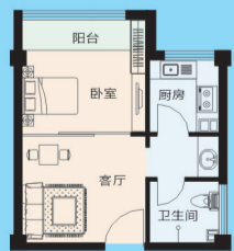
推荐户型: 39.75m 2 一房(房号322)