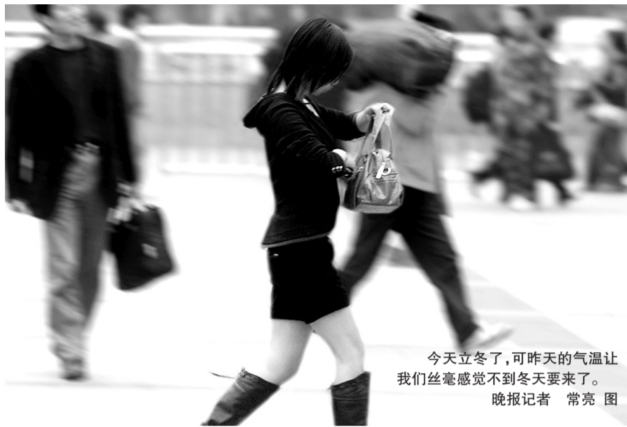
今天立冬了,可昨天的气温让我们丝毫感觉不到冬天要来了。

天文专家提醒说,立冬后剧烈的降温,特别是冷暖异常的天气对人们的生活健康以及农业生产均有严重的不利影响,因此,注意天气预报,根据天气变化搞好人体防护和农作物寒害