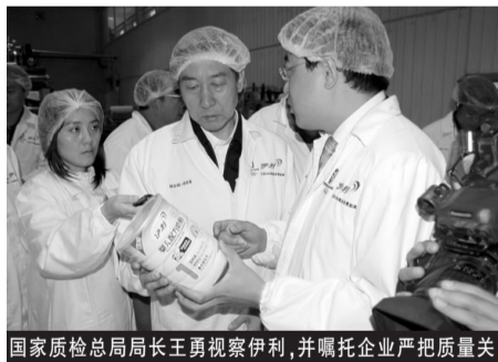
国家质检总局局长王勇视察伊利,并嘱托企业严把质量关

作为中国乳业的龙头企业,国家各相关部门对伊利一直给予着极大的关心和重视。“伊利放心奶工程”开展一个多月以来,已有多位领导视察了伊利工厂,并对伊利的工作给予了充分的肯定和鼓励。