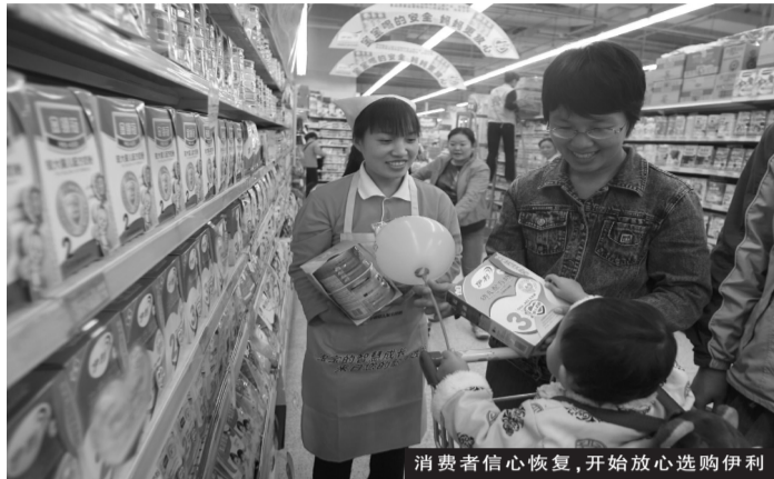
消费者信心恢复,开始放心选购伊利

自9月中旬开始,已有来自北京、内蒙、上海、广州、成都、安徽、黑龙江和江苏等全国31个省、市、自治区的数万名消费者、数百名国内媒体记者、数十名境外媒体记者亲眼见证了伊利在奶源管理、生产管理、质量管理等生产全过程开展的“放心奶工程”,伊利优质的奶源、严格的管理、先进的技术装备让到访者相信伊利这样的企业完全有能力为消费者提供安全放心的乳产品。