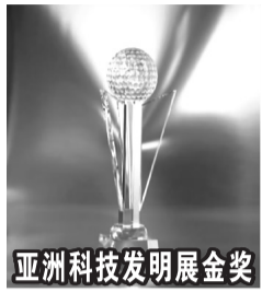
亚洲科技发明展金奖