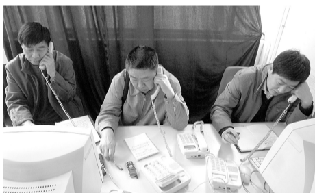
热力公司负责人接听晚报热线。