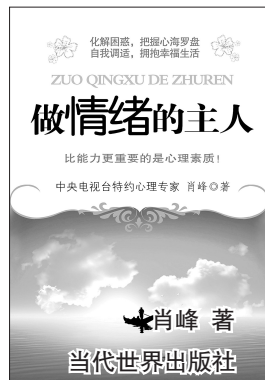
做情绪的主人 肖峰著 当代世界出版社