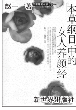
本草纲目中的女人养颜经 赵一著 新世界出版社