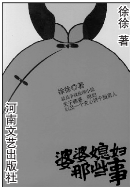
徐徐著 婆婆媳妇那些事 河南文艺出版社