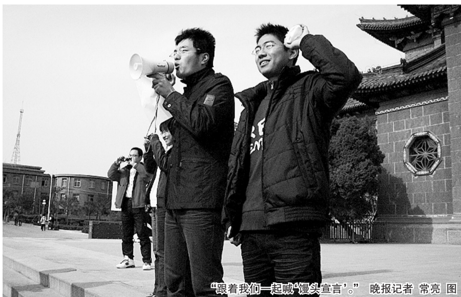
“跟着我们一起喊‘馒头宣言’。”

读者来电 昨日一名河南大学的学生说，在我们学校，很多学生举着馒头宣誓，“忠于馒头，爱惜粮食……”还有很多人陆陆续续加入。