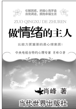
化解困惑,把握心海罗盘 自我调适,拥抱幸福生活 ZUO QINGXU DE ZHUREN 比能力更重要的是心理素质! 中央电视台特约心理专家 肖峰 著 当代世界出版社

其实人世间的任何事不都是同一个道理吗:如果我们拥有正确的观念,站在合适的立场,调整好适当的角度,那么快乐就常伴在你的身边。 46