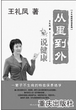
王礼凤著 从里到外 说健康 一辈子不生病的特效保养绝学 重庆出版社

引起内部斗争,甚至造成家庭破裂。健康就是人体各个组织之间,以及人体与外界环境之间达到相对平衡的和谐状态。比如五脏除了要发挥好各自的功能之外,五脏之间相互滋生,又相互制约,共同维持着生命的正常活动。如果这种秩序不被扰乱,人体的一切功能正常,就表现为健康;如果打破了这种循环规律,就会引发脏腑功能紊乱。如暴饮暴食损伤了脾,脾土就不能协助肺金完成其宣发肃降的功能,人体就会出现咳嗽咯痰的症状;如果脾土受伤,则不能制约肾水,会出现水肿等水湿泛滥的症状;而肾水失去了脾土的制约,则会过度约束心火,导致心悸、怔忡;以此类推,引起种种不适,人体就表现出疾病的状态。 01