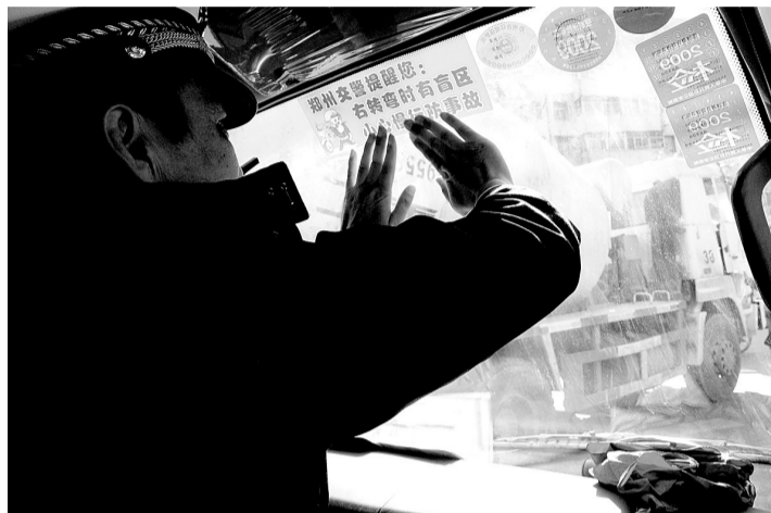
民警在大型车辆的挡风玻璃右侧贴上右转弯慢行的提示标语。