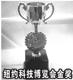
纽约科技博览会金奖

天天吃药，定期扩充血管，高血压已经成为人类第一健康杀手，特别是中老年人高血压突发，摔伤事小，万一猝死……作为一种新型绿色降压方式，不打针不吃药轻松降压，远离药害防止猝死，新一代岳氏降压表的问世，并被高血压患者亲切的称为“手腕上的降压仪”，贴身的保健医生。今天高血压专家就为你揭秘作用于内关穴、外关穴、神门穴、阳池穴、列缺穴、太渊穴六大降压安神穴位上降压表的神奇内幕。