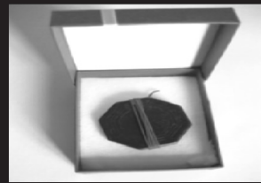
天珠护心宝功能简介：能有效的护心保脑，预防心脑血管疾病。