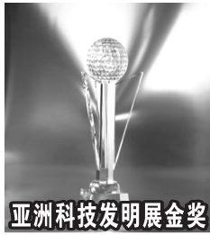
亚洲科技发明展金奖